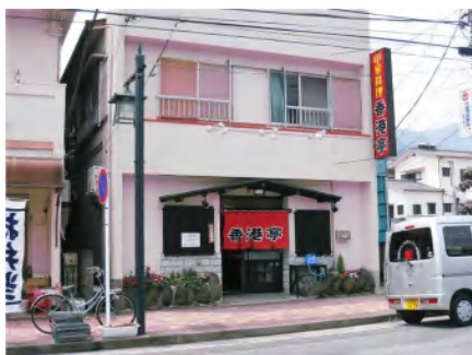
JR湯河原駅下車、正面階段を降りて左折胃腸病院に向かう

て、少 の右側 にお店 はあり ます。 平成2 0年1 1月に 本格中 オ1月 ン1た 本格中