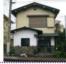
毎日の様に通っているので暖簾を出すのが私の仕事になりました。

湯河原駅をまっすぐ海岸通りに向かって行くと、左側に出光島袋商店さんのGSがあります。その手前左側に居酒屋「潮」さんがあります。