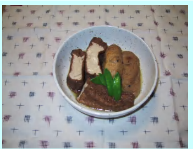
妻がいつも煮てくれる三角の厚揚げ・・・なんとも美味しい!