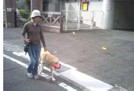
訓練風景です。小田原から伊東まで出張いたします!!

私の家にも私が小学校の前で拾ったマリリンというワンちゃんがいきました。雑種ですが、愛嬌があり食べ物に目が無い食いしん坊の可愛い犬でした。寿命で数年前に亡くなりました。とてもじゃないですが、もう動物を飼うことができないかもしれないかもしれません。それぐらいかけがえの無い思い出をたくさん作ることができ、今でも感謝しています。