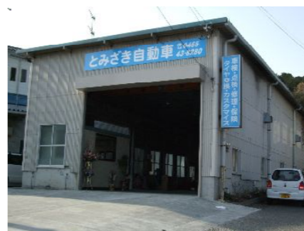
元、俵石材さんの加工場が作業場です