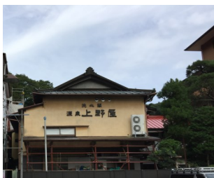
奥湯河原の隠れ宿。木々に囲まれた趣ある建物が上野屋様です。

平成二十八年十月、湯河原温泉老舗旅館「上野屋旅館」様で下期決起会を盛大に開催しました。上野屋旅館様は、江戸時代から続く老舗中の老舗旅館です。大正から昭和にかけて建築され、国の有形文化財に登録されている由緒ある建物でも有名です。