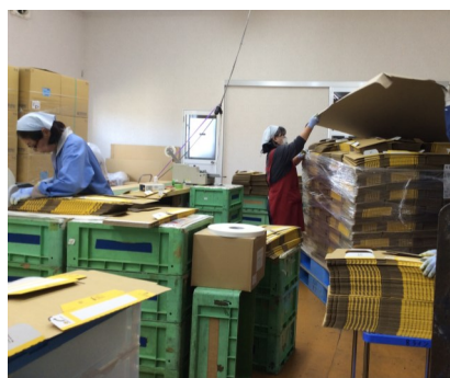
↑たくさんのダンボールが... ←こんなに組み立てられました!