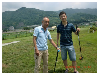
晴れときどきパークゴルフ。爽快なショットを決めました。

「コミュニケーション志向」を大事にしたゲームだそうです。初めてでも、楽しく仲良く出来るのがいいですね。パークゴルフだけでなく、ゴルフ初心者もかなりいて、球がこちらこちらに飛んでいき、どのチームも笑声がたえず、あつという間に時間近くが過ぎ、気持ち良い汗をかきました。なんとホールインワンを取った社員が二名もいて大喝采！さらに帰りには理事からお土産の取れたて新鮮玉ねぎを大袋で頂き、大満足な初体験となりました。