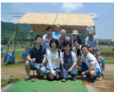
青空の下で全員集合！プレーをしてさらに結束力が強まりました。