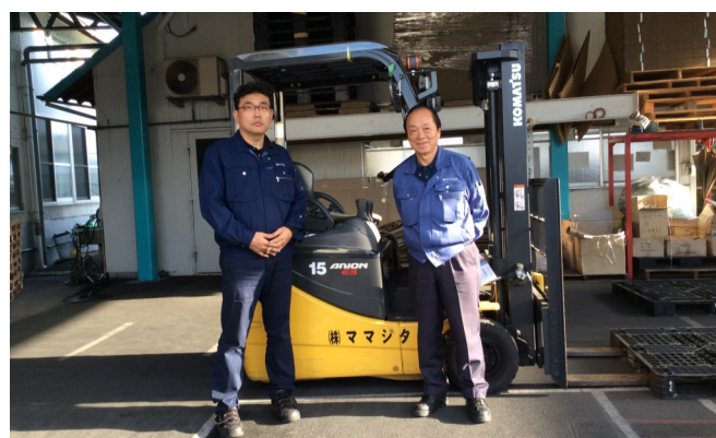
笑顔の素晴らしい社長(右)と立ち姿の頼もしい専務(左)です!