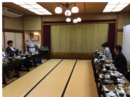
情緒ある大広間は何十人も入れそうな広さ。次から次へと運ばれるお膳で、目も舌も楽しみました。