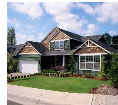
誰もが夢見るマイホーム

◆交通事故に遭ってしまうと大変イヤな思いをします。しかも人身事故ともなると解決までの道筋が長くかかってしまうこともあります。 ◆交通事故でお悩みの方は私どもアイファーストにご相談ください!!