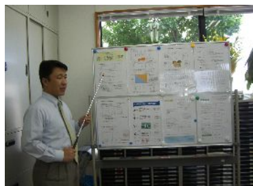
講師は川瀬も担当します！

私どもアイファーストの研修は“気づきの勉強会”と題しています。人は自分が気づかない限り、変わらないからです。知らず知らずに向上心がわいてくるような勉強会です。