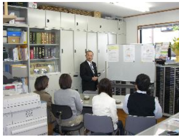
アイファーストにて研修実施

私どもアイファーストの研修は“気づきの勉強会”と題しています。人は自分が気づかない限り、変わらないからです。知らず知らずに向上心がわいてくるような勉強会です。